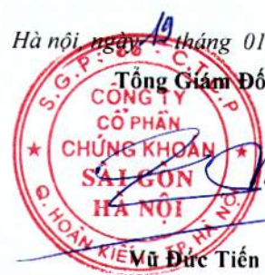
WU DUC TIEN